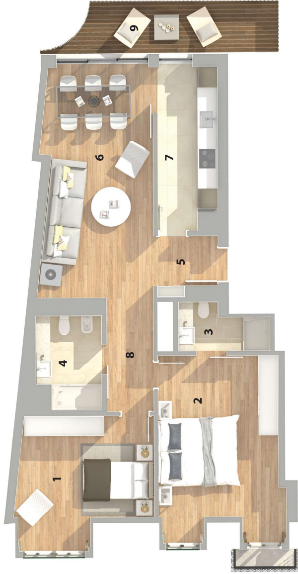
Piso 1 | Floor 1